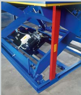
Aggregat zwischen den Scheren positioniert. Gewährleistet sicheren Betrieb bei eventuellem Wassereintritt.