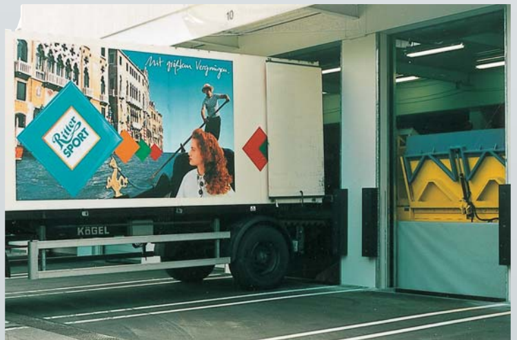
Hydraulische Ladeklappe mit integrierter hydraulischer Vorschublippe.