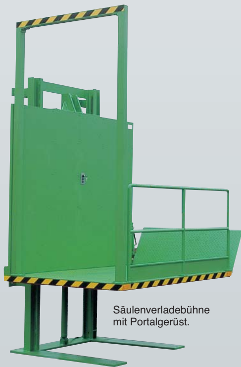
Säulenverladebühne mit Portalgerüst.