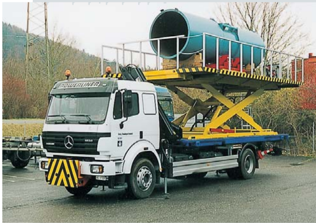
Hebebühne zur Montage von Lüftungsventilatoren in Autobahntunneln.