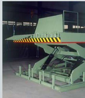
Ladeklappe mit Gasdruckzylinder zum leichten Verschwenken in senkrechter Stellung.