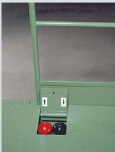
Fußschalter, zum Heben und Senken, in die Plattform integriert.