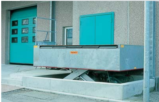
Hydraulische Vorschublippe mit klappbaren Segmenten.