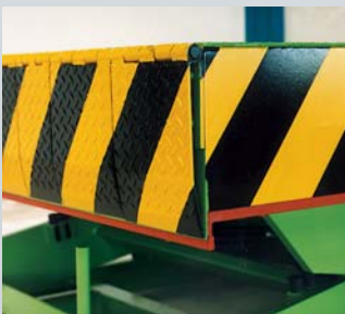
Ladeklappe in hängender Ausführung.