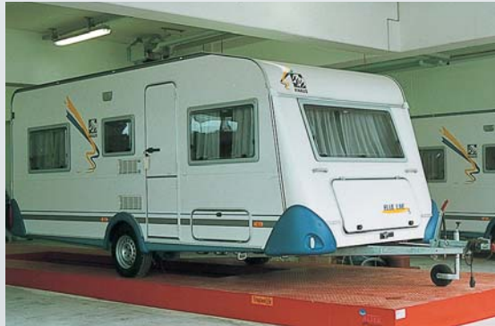
Versenkbare Hubtischplattform ermöglicht das Arbeiten am Dachbereich von Wohnwagen und Wohnmobilen (mit integriertem KfZ-Grubenheber).