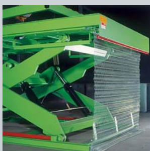
Unterlaufschutz aus Welldrahtgitter in verzinkter Ausführung.