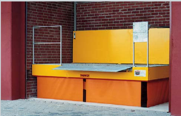
Hubtisch mit Absturzsicherungen, Ladeklappe und Rollos als Unterlaufschutz.