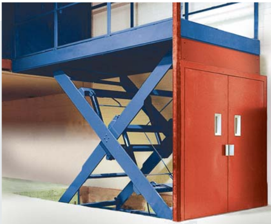
Vereinfachter Güteraufzug nach TRA 300.