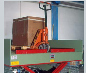
Mechanische Abfallsicherung, verhindert das Abstürzen der Güter.