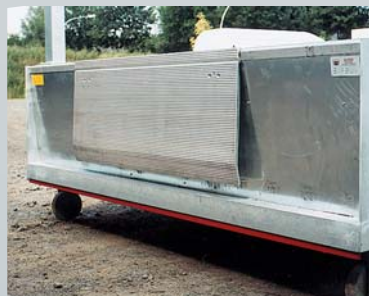
Ladeklappe aus Aluminium, über die gesamte Länge verschiebbar.